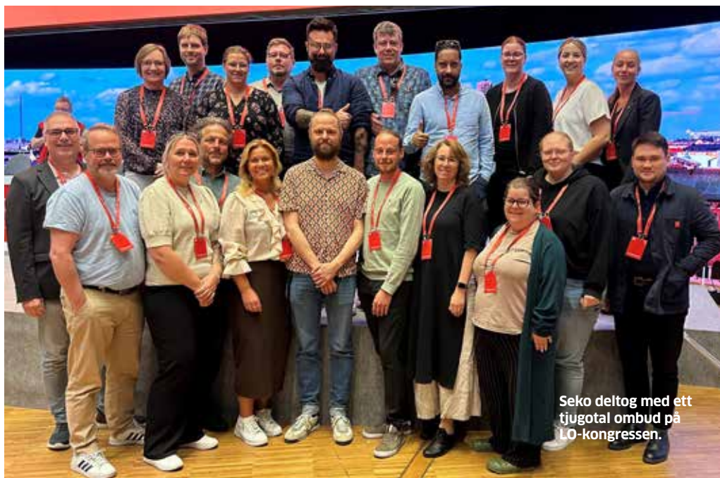
Seko deltog med ett tjugotal ombud på LO-kongressen.