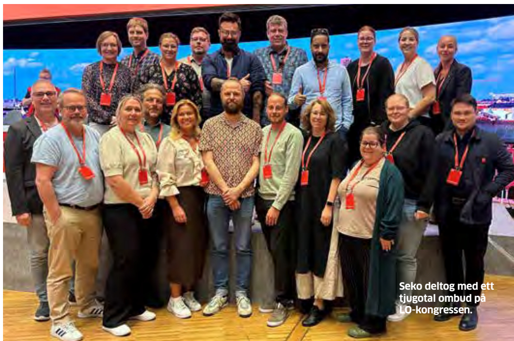
Seko deltog med ett tjugotal ombud på LO-kongressen.