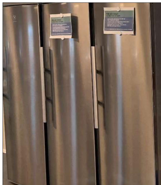
Kylskåpen behöver ibland rymma mat för flera dagar.

Det rekommenderas en (1) toalett per 15 personer som vistas mer än tillfälligt på arbetsplatsen. Det bör dessutom placeras toalettmoduler i nära anslutning till där arbete utförs.