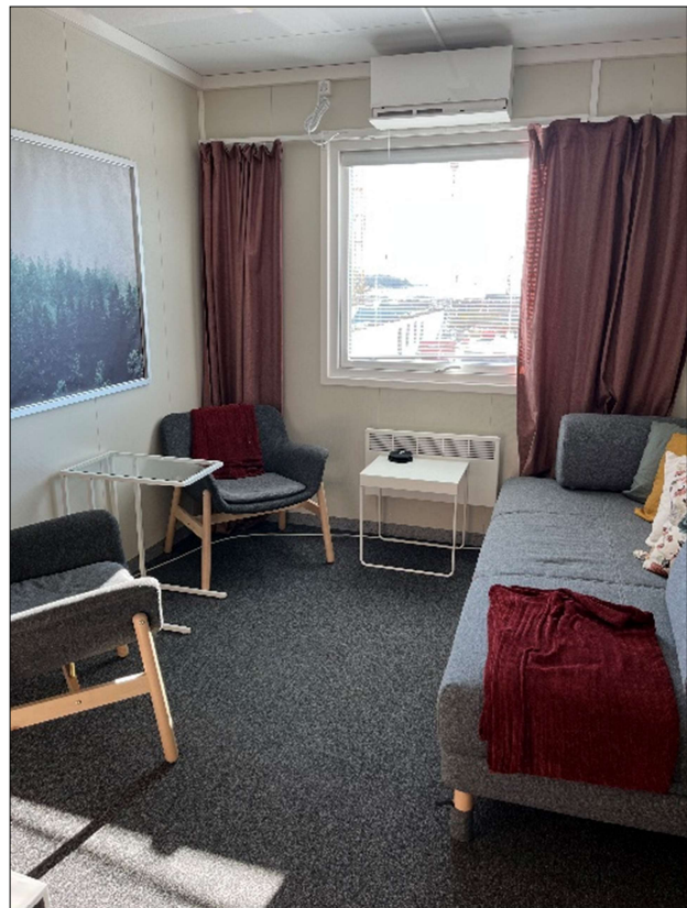
Vilrum behövs på större arbetsplatser. Men även i mindre etableringar ska det gå att ordna för tillfällig, ostörd och liggande vila.

Med en genomtänkt struktur för etableringen kan samarbetet mellan alla på arbetsplatsen underlättas. På större arbetsplatser kan en gemensam yta för raster bidra. Det gäller dock att klokt hantera behovet av rast och vila med möjligheter till arbetsmöten.