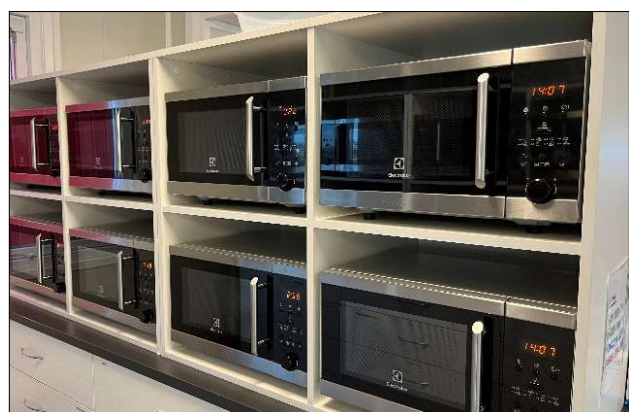
Tillräckligt med mikrovågsugnar är viktigt.

Det behövs ett tillräckligt antal mikrovågsugnar/värmesåp så att alla hinner värma inom rimlig tid.