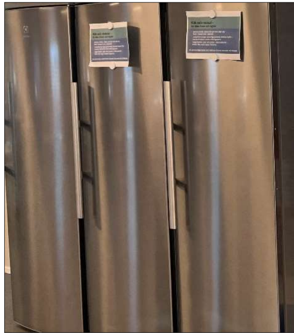
Kylskåpen behöver ibland rymma mat för flera dagar.

Det rekommenderas en (1) toalett per 15 personer som vistas mer än tillfälligt på arbetsplatsen. Det bör dessutom placeras toalettmoduler i nära anslutning till där arbete utförs.