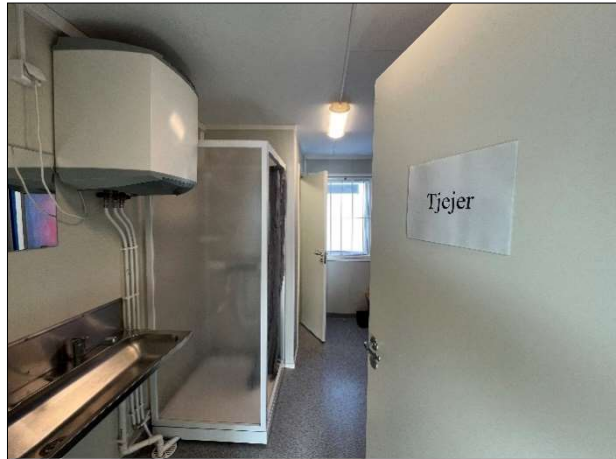
I en större etablering är det lätt att skapa avskiljbara utrymmen med särskilda bodar.

Kollektivavtalet anger att det ska finnas ett låsbart torkutrymme, torkskåp eller motsvarande torkanordning med kapacitet att torka kläder och skor till nästa arbetsdag. Detta innebär att det för arbetsplatser med arbete utomhus, svett drivande arbete eller som smutsar/blöter ner arbetskläder kan krävas ett särskilt utrymme för effektiv torkning av ytterkläder, regnkläder och skor.