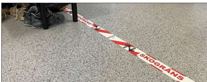
En skogräns är ett bra sätt att få en renare och trevligare miljö i personalutrymmet. Inomhus är det tofflor som gäller.

Alla på arbetsplatsen kan bidra till en ren och trivsamt miljö i personalutrymmena. Inte minst för att underlätta för städpersonalen. En överenskommen "skogräns" är ett bra sätt att motverka exponering för damm och partiklar.