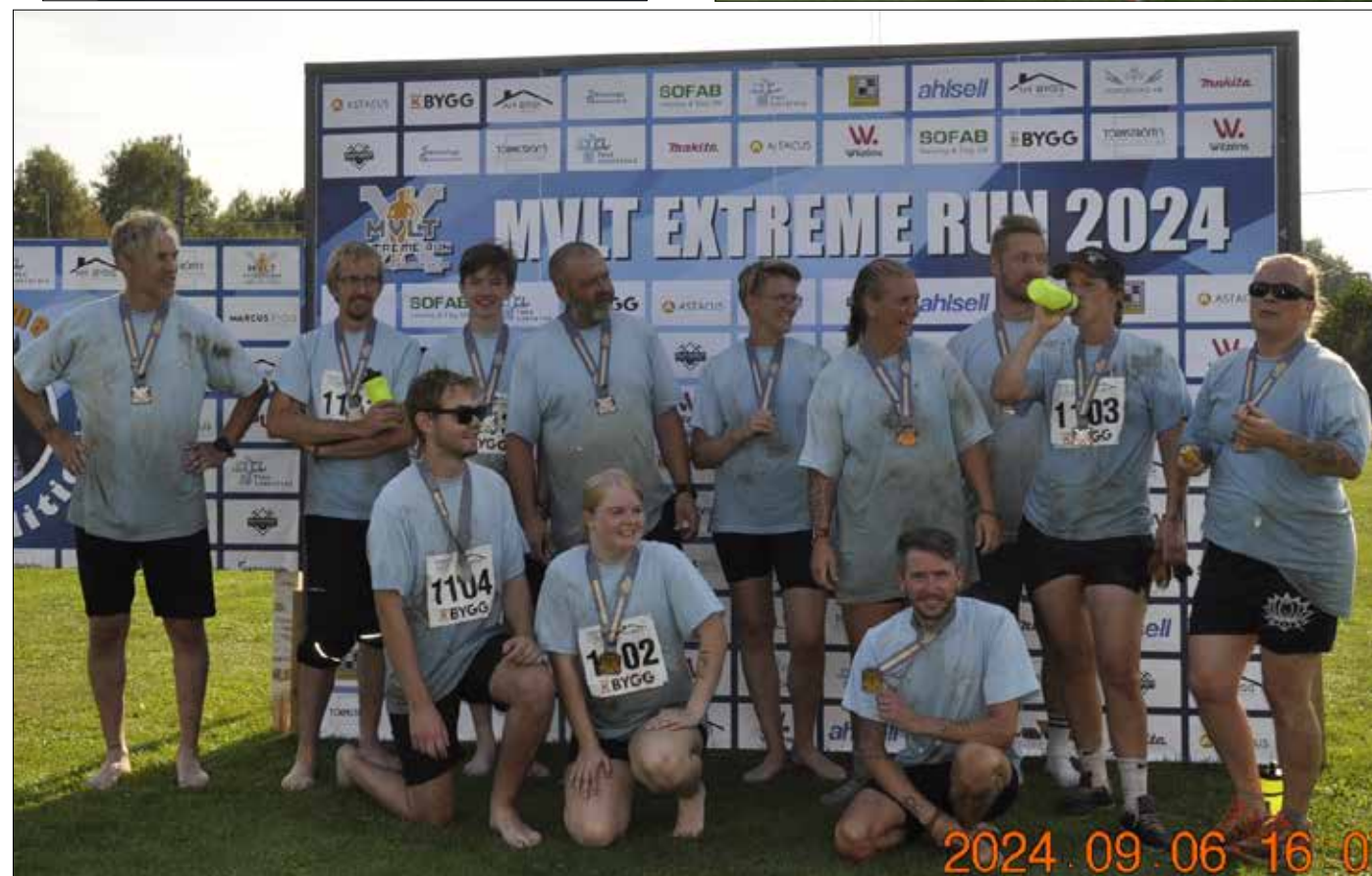
Tolv, inte så lite stolta, sekoitiska deltagare i Extreme run.