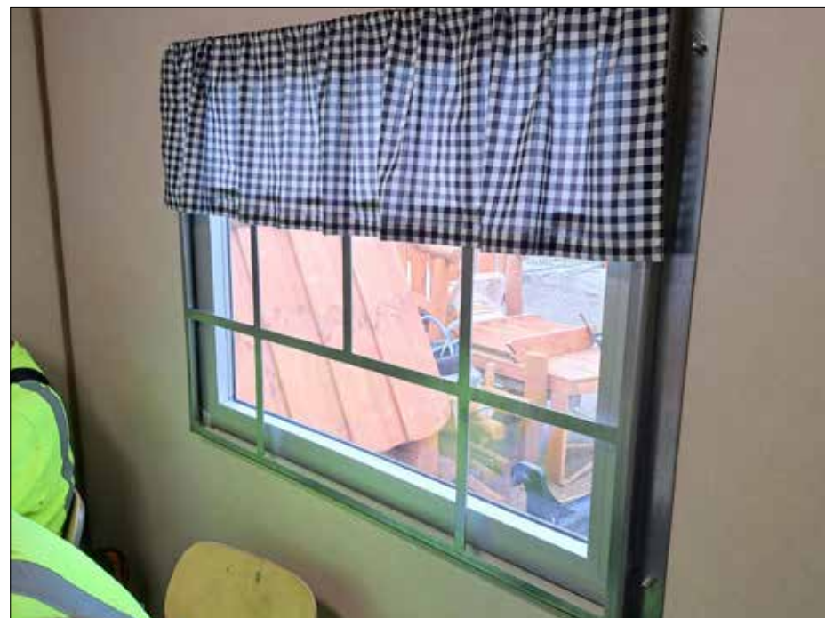
Om det skulle börja brinna i boden. Hur tar du dig ut om dörren är blockerad?