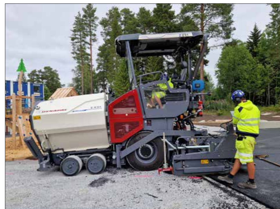
Tyst och fint... Det går utmärkt att använda vanlig samtalston.