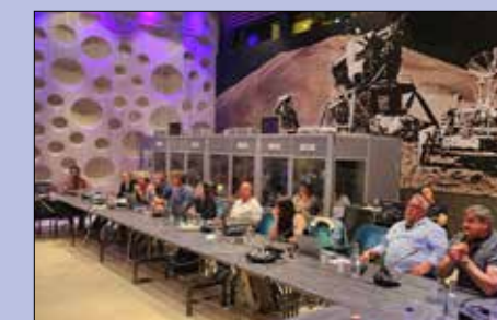
I båsen bakom deltagarna sitter tolkar.