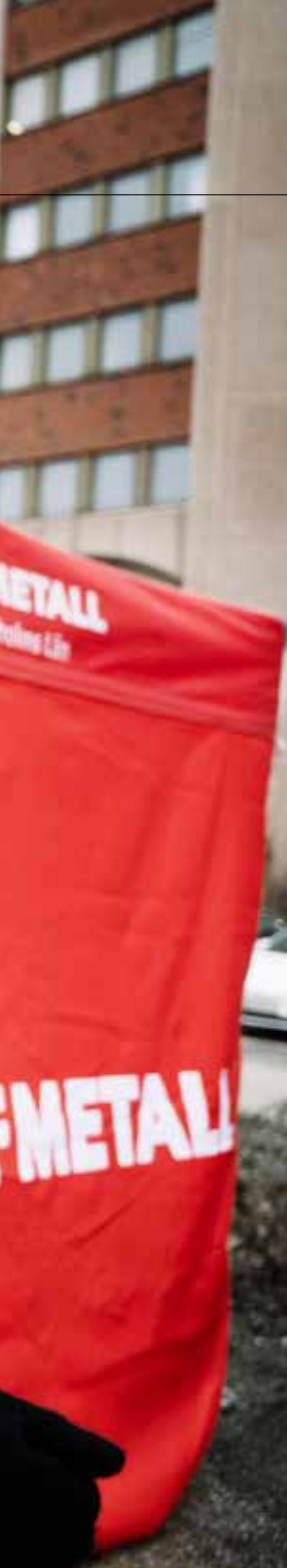
Blockad. Seko deltar vid IF Metalls blockad mot Tesla.

”Teslas ständiga försök att kringgå våra varsel är ytterligare ett exempel på deras brist på respekt för den svenska kollektivavtalsmodellen.”