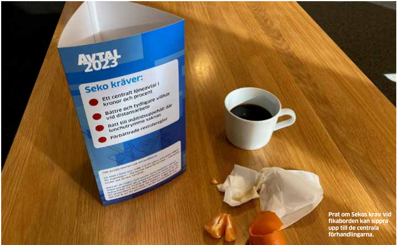
Prat om Sekos krav vid fikaborden kan sippra upp till de centrala förhandlingarna.

- Det är tydligt att vi och arbetsgivarna har olika syn på i stort sett allt.