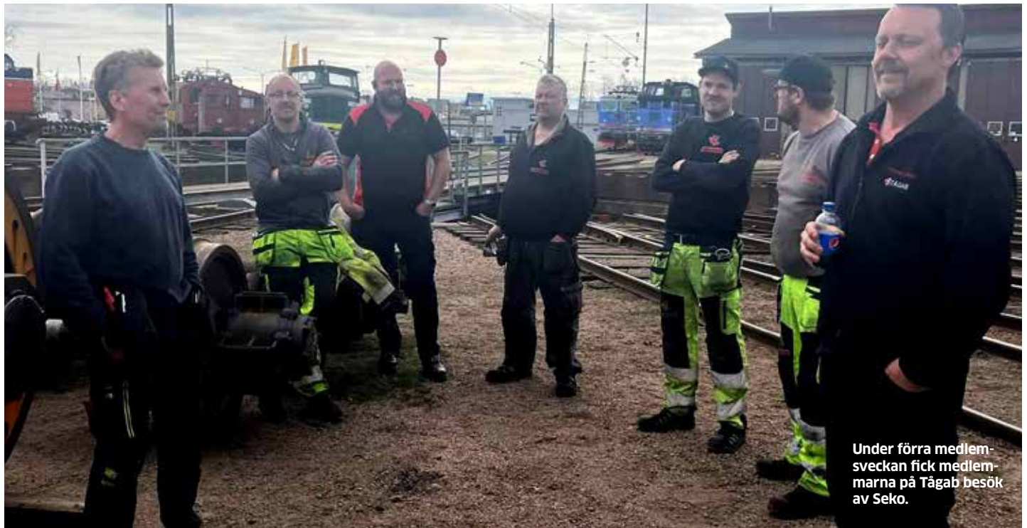
Under förra medlemsveckan fick medlemmarna på Tågab besök av Seko.