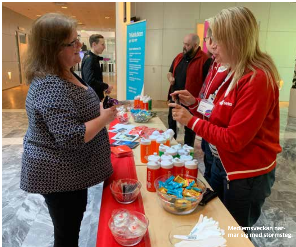
Medlemsveckan närmar sig med stormsteg.

FÖR ATT ORGANISATIONEN ska få bättre koll på sina in- och utträden kommer alla klubbar, regioner, förhandlingsorganisationer och branschorganisationer nu, från april, få siffror om den egna medlemsutvecklingen.