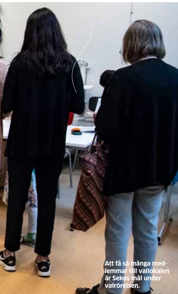
Att få så många medlemmar till vallokalen är Sekos mål under valrörelsen.