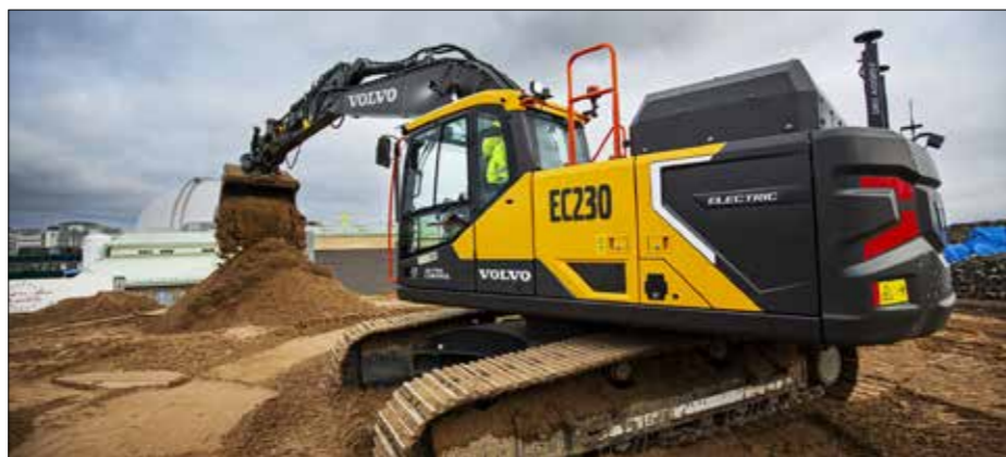
En av maskinerna som arbetar vid det fossilfria bygget av förskolan Ottfjället i Östersund är en EC230 Electric, den största maskinen i Volvos eldrivna produktutbud.

När spaden sattes i jorden för byggandet av förskolan Ottfjället i Östersund i juni höjdes ribban för klimatsmart byggande. Projektet beskrivs som EU:s första elektrifierade byggarbetsplats — i varje fall till 95 procent.