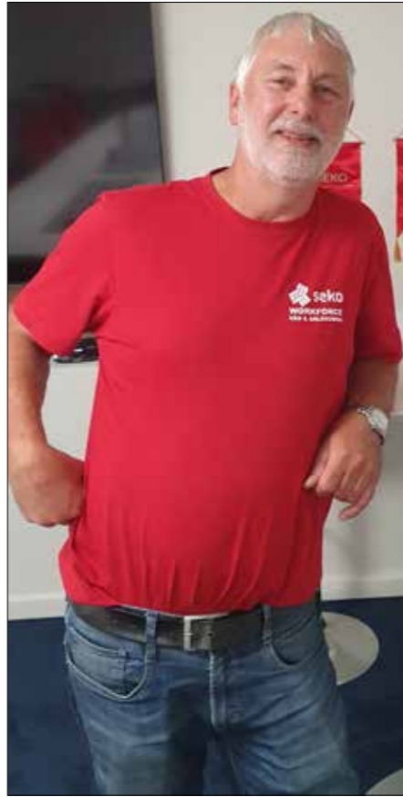
Ove har förstås lovat att han skall aktivera sig i pensionärssektionen, så vi kanske får se mer från honom framöver.