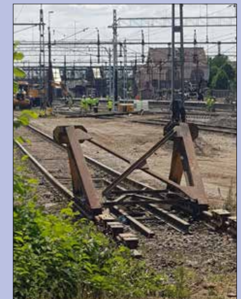
Bilderna är tagna i samband med en skydds rond på Alvesta bangård.