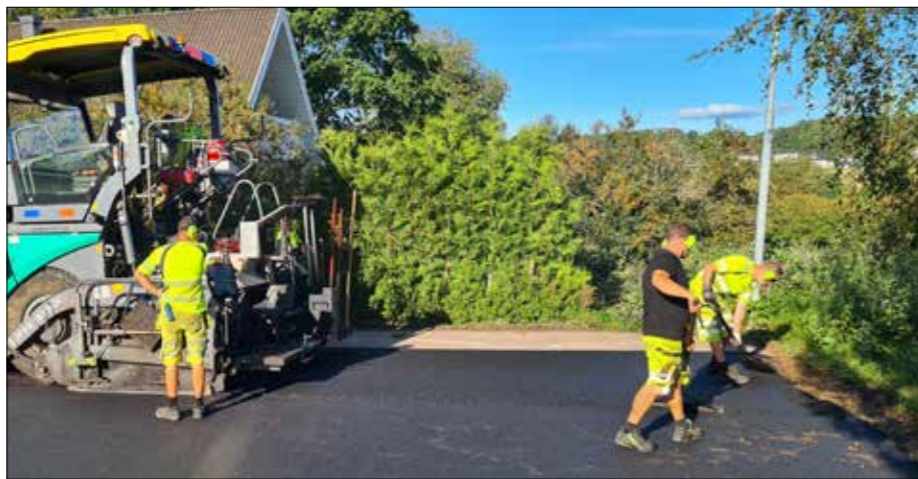
Sommar och sol kommer tillbaka från en blöt semester, och allt är väl med NCC läggarglag "team Sander" i Gävle. De önskar sig en fin höst med värme och trevliga trafikanter.

Vad är det för skillnad på en död tvilling? Han är mer lik än sin bror. Red anm: Denna vits kommer inte från Ove.