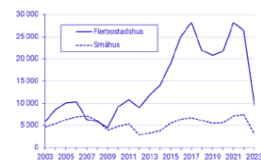
Påbörjade lägenheter i nybyggnad under första halvåret 2003-2023

Av de påbörjade lägenheterna finns ungefär 3500 i småhus, vilket är 53 procent färre än under samma period 2022. I flerbostadshus påbörjades ungefär 11050 lägenheter, vilket är 58 procent färre än första halvåret 2022. Av lägenheterna i flerbostadshus är preliminärt 71 procent upplåtna som hyresrätter.