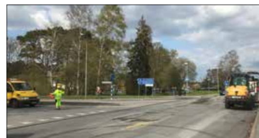
NCC Fräs och Rentsafe någonstans i Skåne.