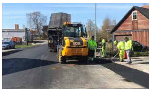
NCC Asfalt i Sösdal.