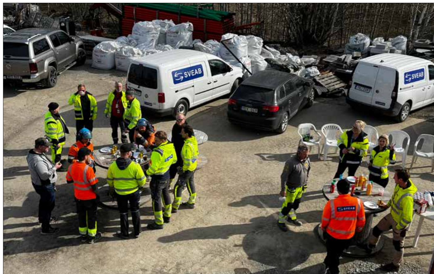
Grillning hos Sveab i Solna.