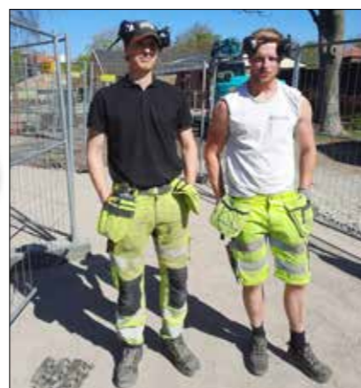
Persmarken Entreprenad AB i Malmö.