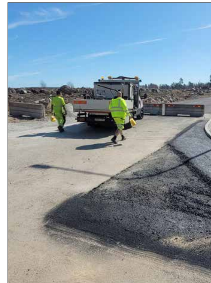
... hos NCC Asfalt...