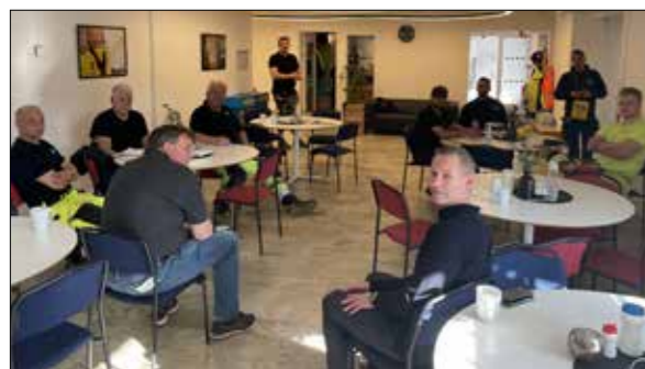
Träff på ELTEL i Malmö.