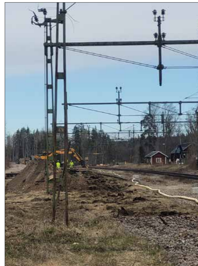
... hos Infrakraft...