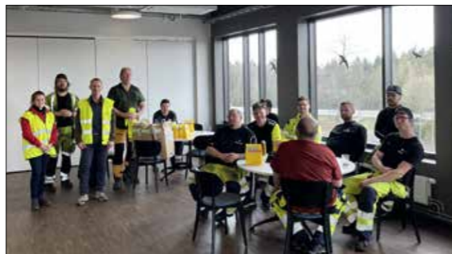
Besök på Mantena i Hässleholm som har hand om underhållet av Öresundstågen.