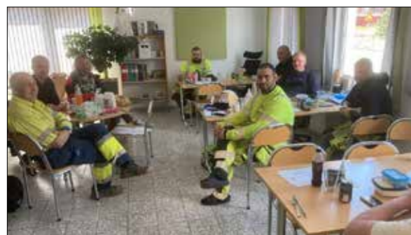
Besök på Ystad Energi.