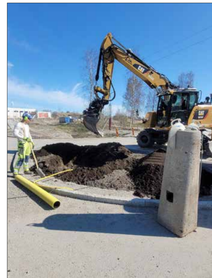
... och hos Skanska.