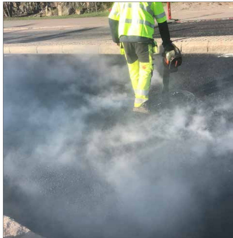
Det går utmärkt att använda lövblås för att rengöra brunnar...