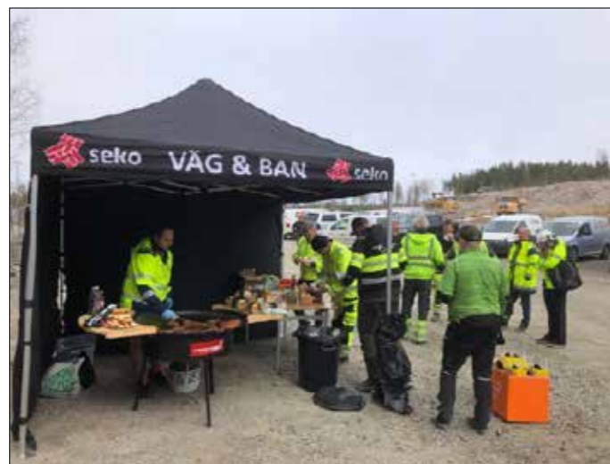
Klubben i Värmland Örebro var i Axeda...

Under vecka 17 var många av förbundets och klubbarnas förtroendevalda ute på arbetsplatserna och pratade med medlemmar. Här kommer ett axplock med bilder därifrån. De till vänster är från Sollentuna och Solna. De till höger är från Värmland-Örebro.