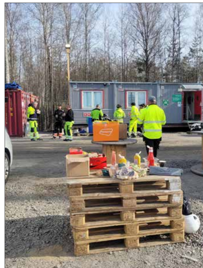
... hos NRC...