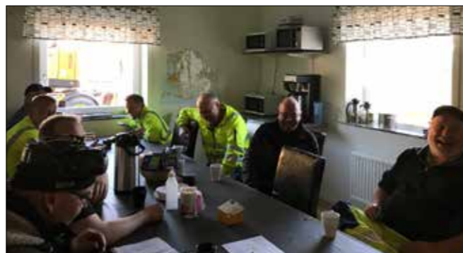
Morgonmöte på Terranor i Skurup.