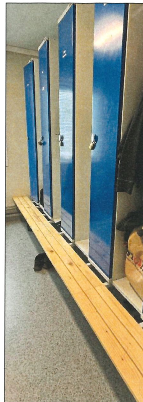
Ett läsbart 30 cm skåp för egna kläder, ytterligare 30 cm för arbetskläder och en sittbänk på 30 cm är ett krav enligt kollektivavtalet.

Personalutrymmen får inte användas samtidigt för andra ändamål eller vara inredda så att funktionen försämras. Det får t.ex. inte användas som förråd eller reparationsplats.