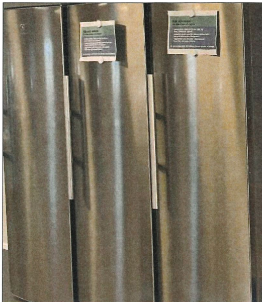
Kylskåpen behöver ibland rymma mat för flera dagar.

Det rekommenderas en (1) toalett per 15 personer som vistas mer än tillfälligt på arbetsplatsen. Det bör dessutom placeras toalettmoduler i nära anslutning till där arbete utförs.