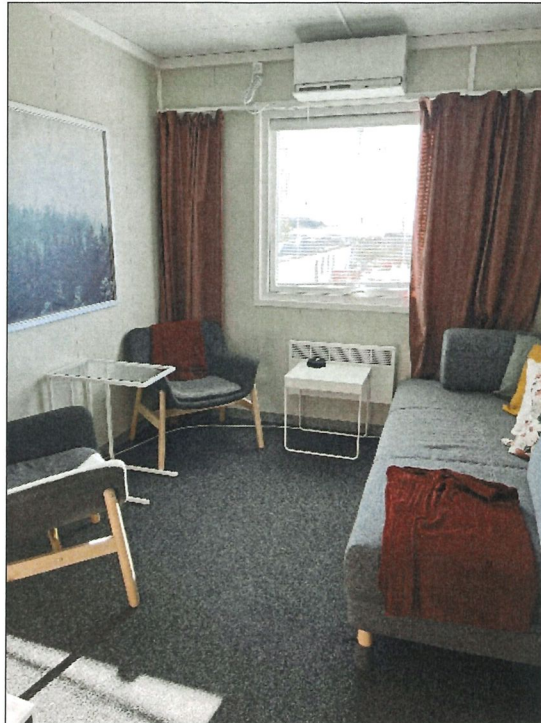
Vilrum behövs på större arbetsplatser. Men även i mindre etableringar ska det gå att ordna för tillfällig, ostörd och liggande vila.

Med en genomtänkt struktur för etableringen kan samarbetet mellan alla på arbetsplatsen underlättas. På större arbetsplatser kan en gemensam yta för raster bidra. Det gäller dock att klokt hantera behovet av rast och vila med möjligheter till arbetsmöten.