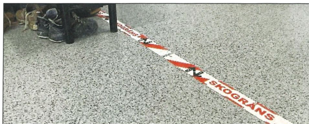
En skogrens är ett bra sätt att få en renare och trevligare miljö i personalutrymmet. Inomhus är det tofflor som gäller.

En viktig anledning till en noggrann städning är att undvika att användarna utsätts för damm och partiklar när de är oskyddade i samband med ombyte och rast.