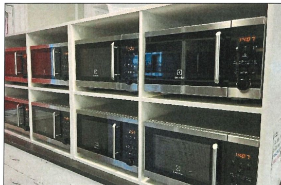
Tillräckligt med mikrovågsugnar är viktigt.

Det behövs ett tillräckligt antal mikrovågsugnar/värmeskåp så att alla hinner värma inom rimlig tid.