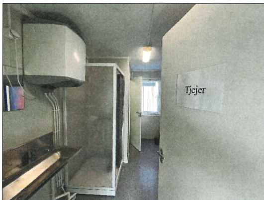
I en större etablering är det lätt att skapa avskiljbara utrymmen med särskilda bodar.

Kollektivavtalet anger att det ska finnas ett låsbart torkutrymme, torkskåp eller motsvarande torkanordning med kapacitet att torka kläder och skor till nästa arbetsdag. Detta innebär att det för arbetsplatser med arbete utomhus, svett drivande arbete eller som smutsar/blöter ner arbetskläder kan krävas ett särskilt utrymme för effektiv torkning av ytterkläder, regnkläder och skor.